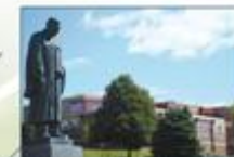
Université de Moncton (Nouveau-Brunswick)