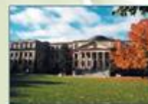
Université d'Ottawa (Ontario)

L'Université canadienne Canada's university