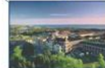
Université Sainte-Anne (Nouvelle-Écosse)