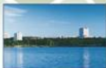
Université Laurentienne (Sudbury, Ontario)

Université Laurentienne Laurentian University