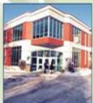
Campus Saint-Jean (Alberta)