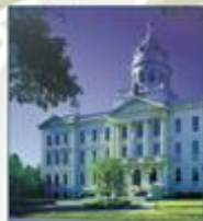
Collège universitaire de Saint-Boniface (Manitoba)