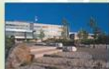
Collège Boréal (Sudbury, Ontario)